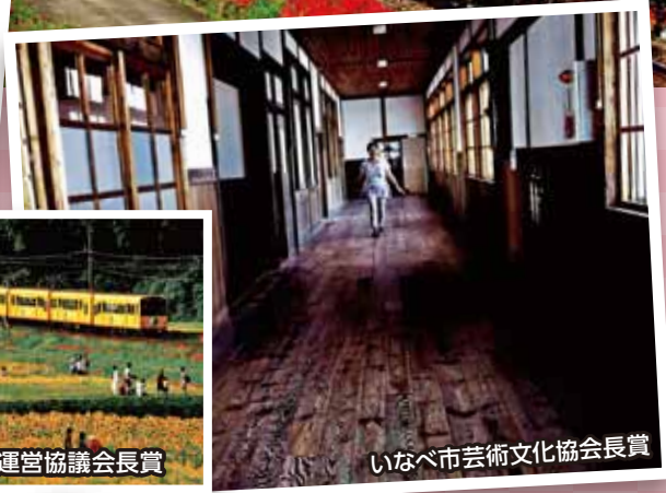
いなべ市芸術文化協会会長賞