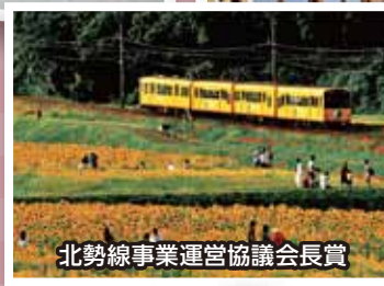
北勢線事業運営協議会長賞