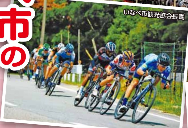
いなべ市観光協会会長賞